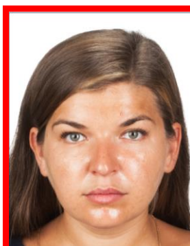
refleksy na twarzy