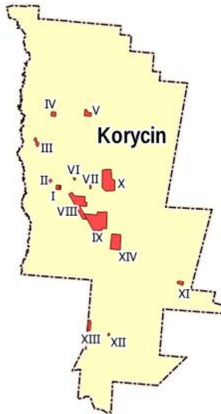
Rys. 1 Obszary opracowania

Obowiązujące Studium uwarunkowań i kierunków zagospodarowania przestrzennego gminy Korycin zostało przyjęte uchwałą Nr XII/56/99 Rady Gminy Korycin z dnia 11 listopada 1999 r. i zmienione uchwałami: Nr XXVI/143/05 z dnia 1 października 2005 r., Nr XXV/168/09 z dnia 5 lipca 2009 r. i Nr XXXIV/219/10 z dnia 2 czerwca 2010 r. Tereny opracowania przeznaczone zostały tu pod następujące funkcje (obszary kolejno):